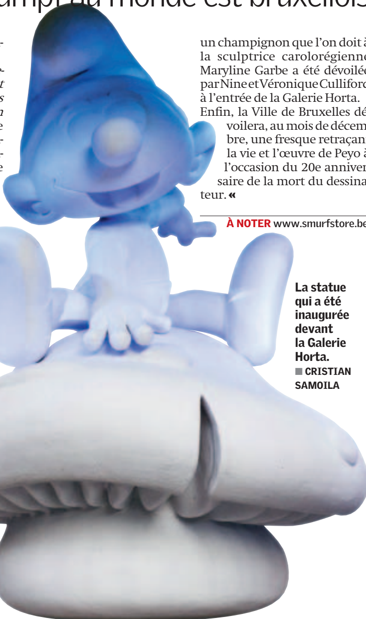
La statue qui a été inaugurée devant la Galerie Horta.

Après l'inauguration de la boutique, une statue de 5 mètres de haut représentant un Schtroumpf assis sur