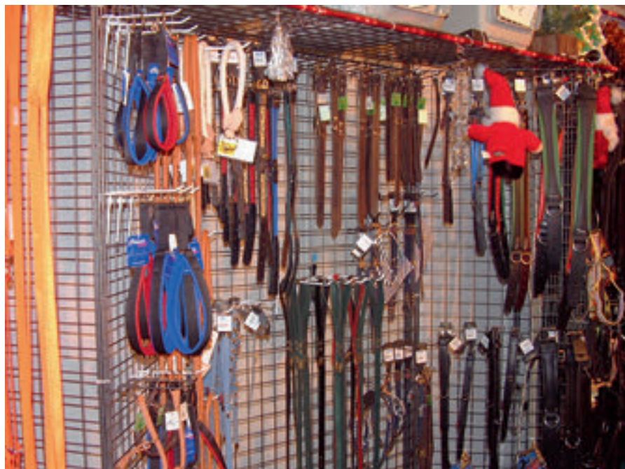
> En matière de colliers, le choix est vaste...

En ce qui concerne les autres colliers électriques, le problème reste le même: souffrances inutiles pour l'animal, sans aucun effet éducatif. Nous retiendrons donc exclusivement le collier électrique anti-fugue, pour autant que l'apprentissage soit correctement effectué par le maître. ●